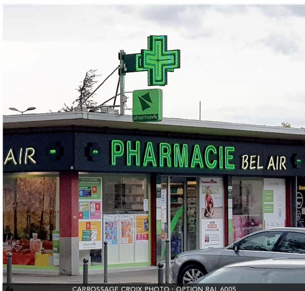
CARROSSAGE CROIX PHOTO : OPTION RAL 6005